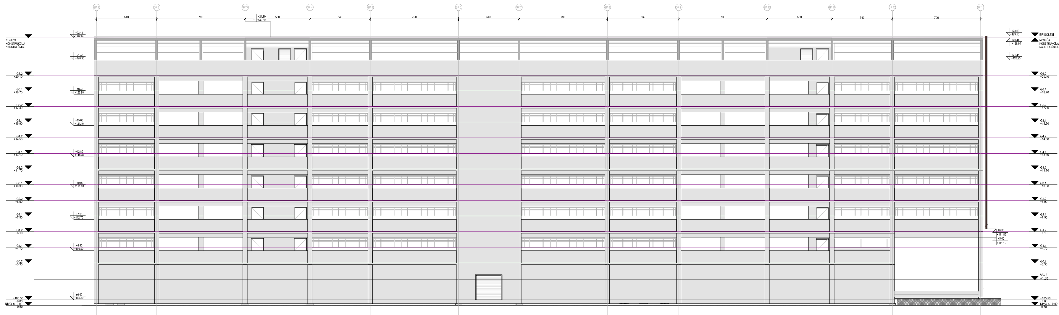
1 Izgled 2 Razmera: 1:100